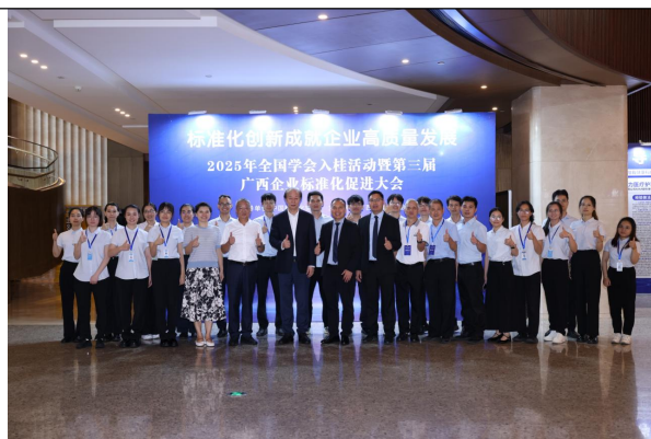
2025 年全国学会入桂活动暨第三届广西企业标准化促进大会上与国际标准化组织（ISO）第 27 届主席张晓刚合影