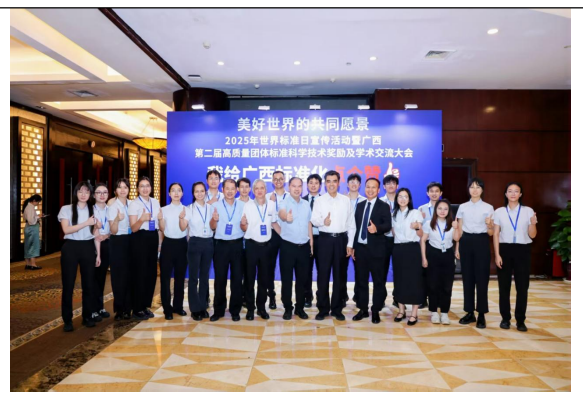
2025 年世界标准日宣传活动暨广西第二届高质量团体标准科学技术奖励及学术交流大会上与中国工程院院士、国际电工委员会第 36 届主席舒印彪合影