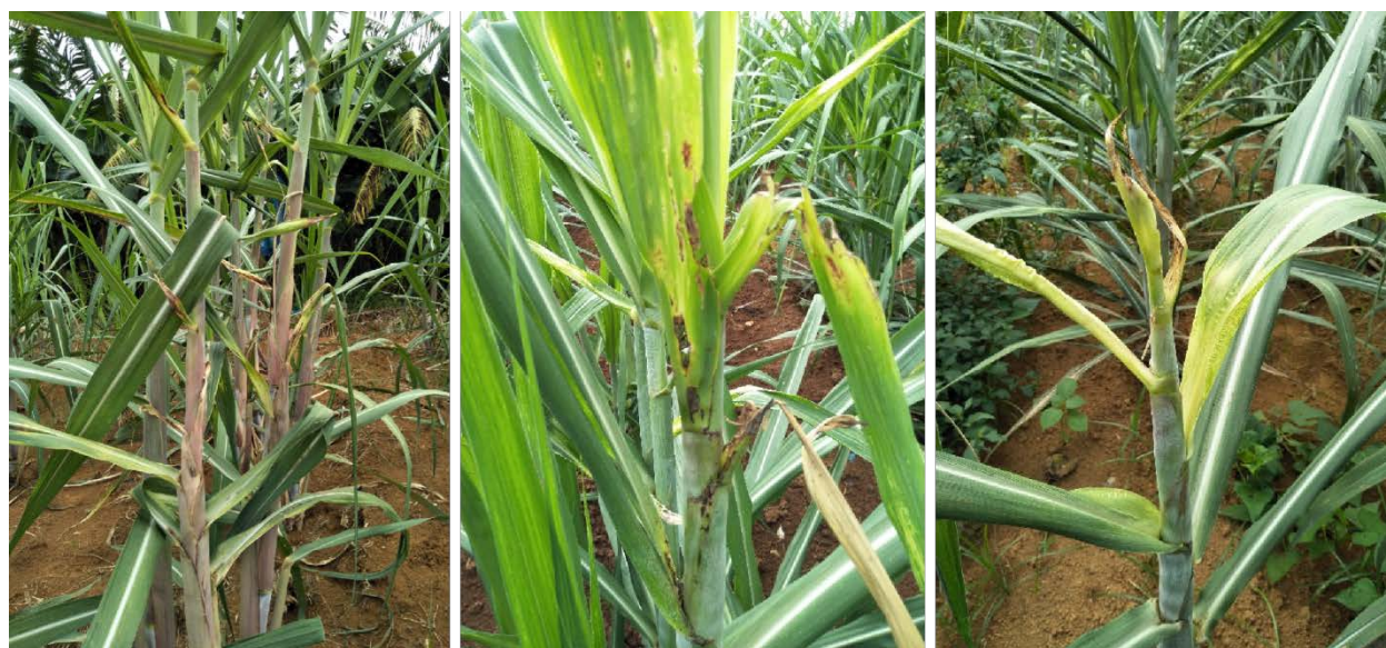
图 B.4 3 级发病症状