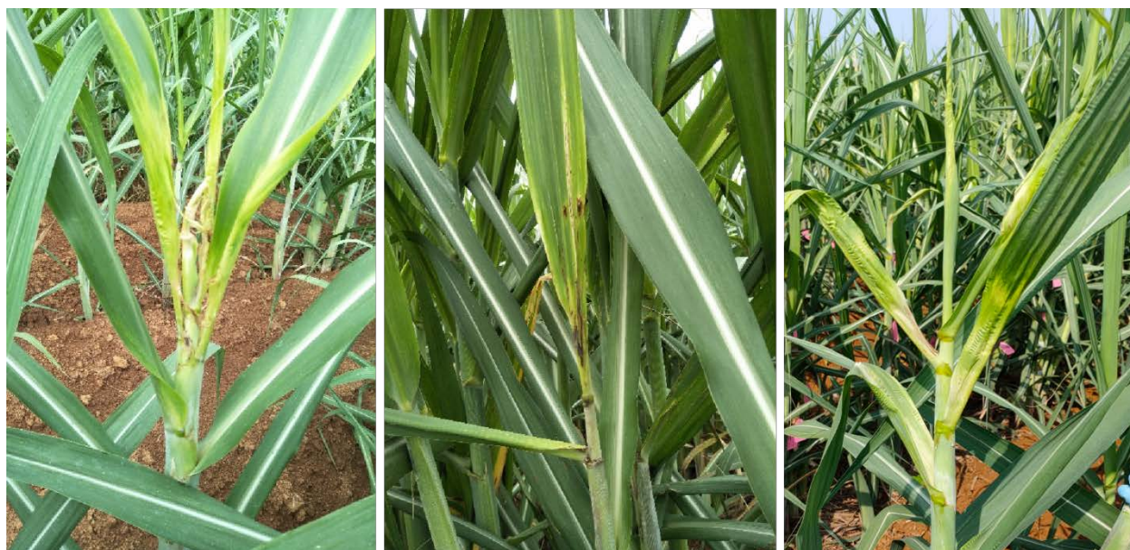
图 B.3 2 级发病症状