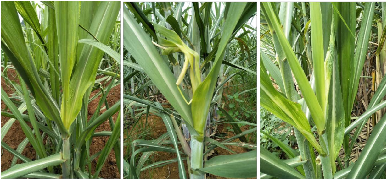
图 B.2 1 级发病症状