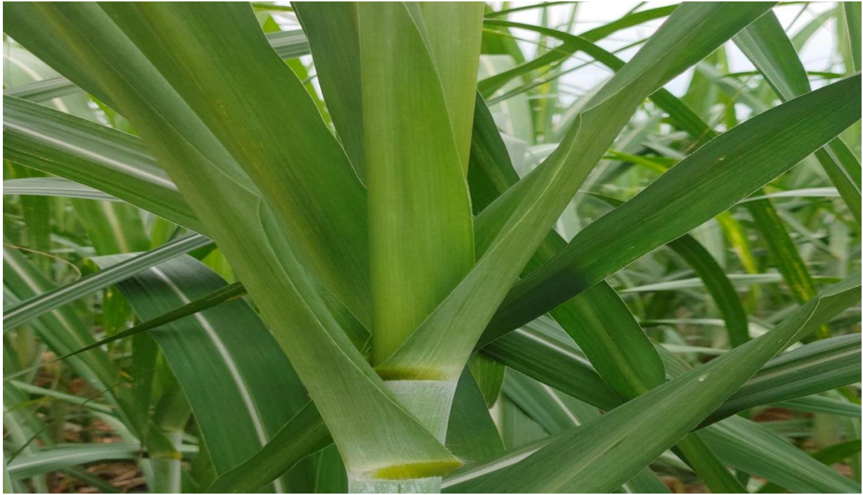
图 B.1 0 级发病症状