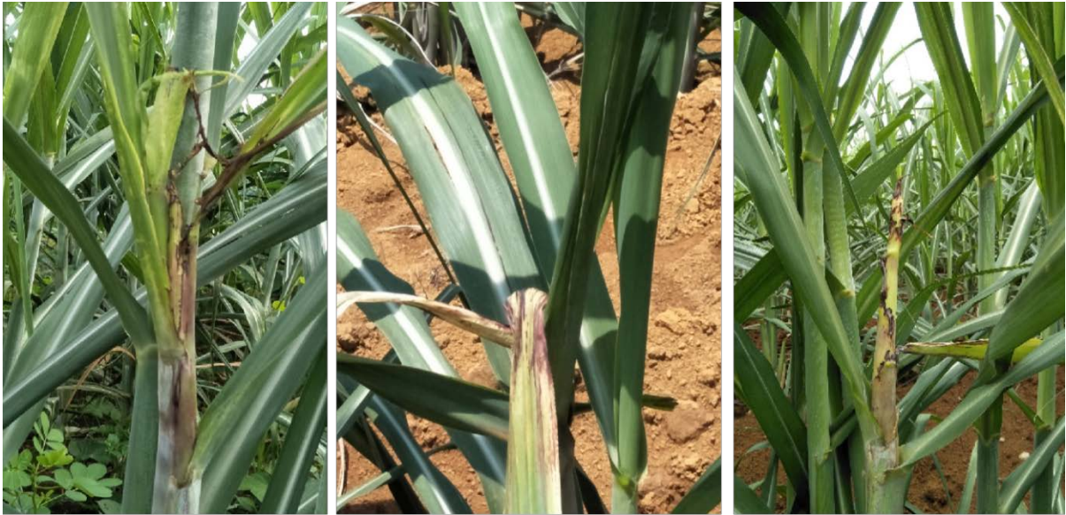
图 B.5 4 级发病症状