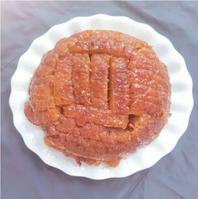
图 C. 2 平乐同安扣肉(夹扣)“丁”字扣成品样式