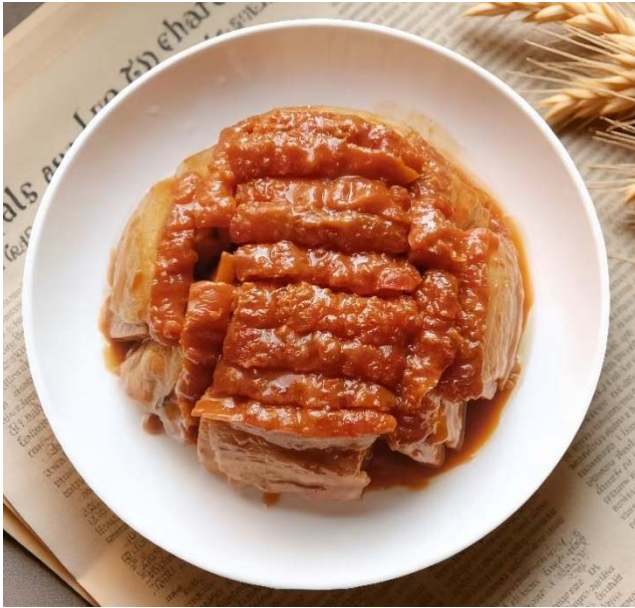
图 C. 1 平乐同安扣肉(夹扣)“夹日”扣成品样式

图C. 1、图C. 2分别给出平乐同安扣肉(夹扣)成品的“夹日”扣和“丁”字扣两种摆放成品样式。