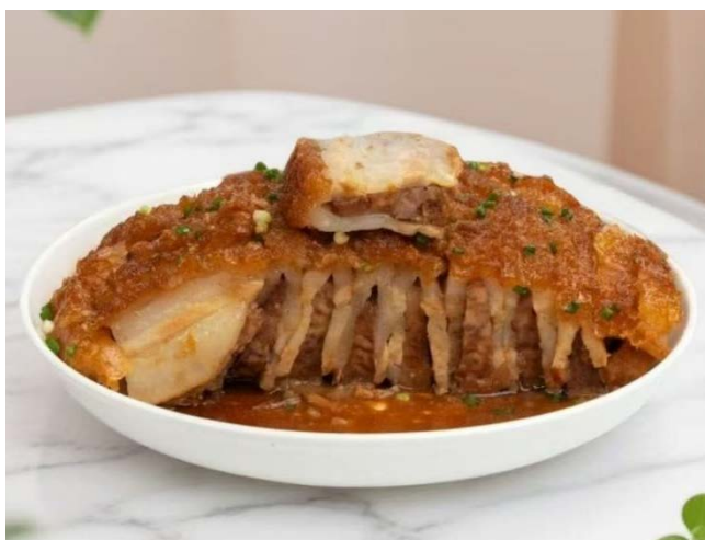
图B 平乐同安扣肉（夹扣）双飞五花肉片夹芋头片样式